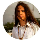
Xiutezcatl Martinez Hip Hop zur Mobilisierung unserer Generation für unsere Erde und Zukunft