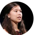
Adora Svitak lehrt Lehrer + Schüler zeitgemäße Lernkultur und Liebe zur Sprache